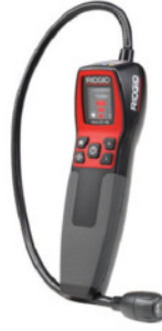
micro CD-100 Yanıcı Gaz Kaçak Dedektörü