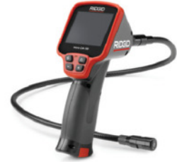
micro CA-100 Gözlem Kamerası