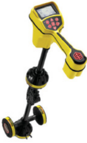
SR-20 Hat Tespit Dedektörü