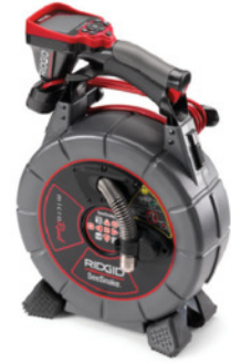
SeeSnake® microReelTM Kanal Görüntüleme Sistemleri