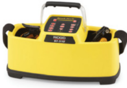
ST-510 Sinyal Vericisi